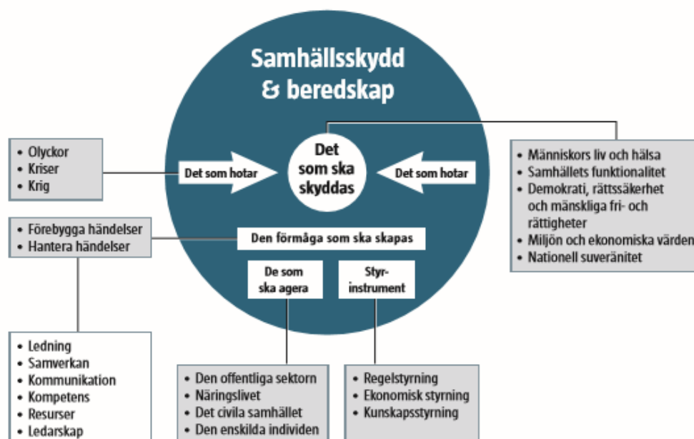
Figur 1MSB modell över samhällsskydd och beredskap.