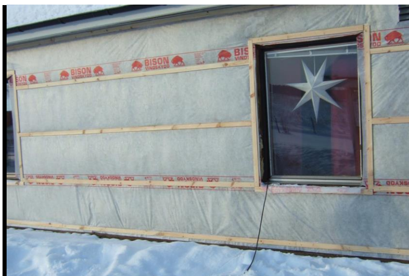
Figur 4 Fasadbyte på en förskola i december.