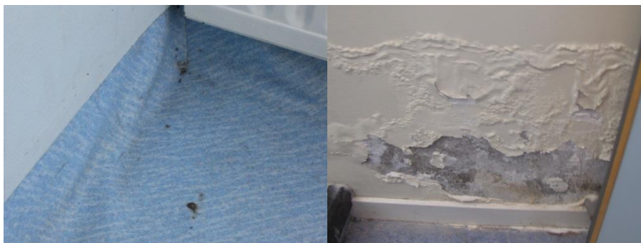
Figur 3 Tecken på fuktskador ska alltid tas på allvar och ska utredas omgående. Foto: Miljö- och byggnadsförvaltningen, 2012