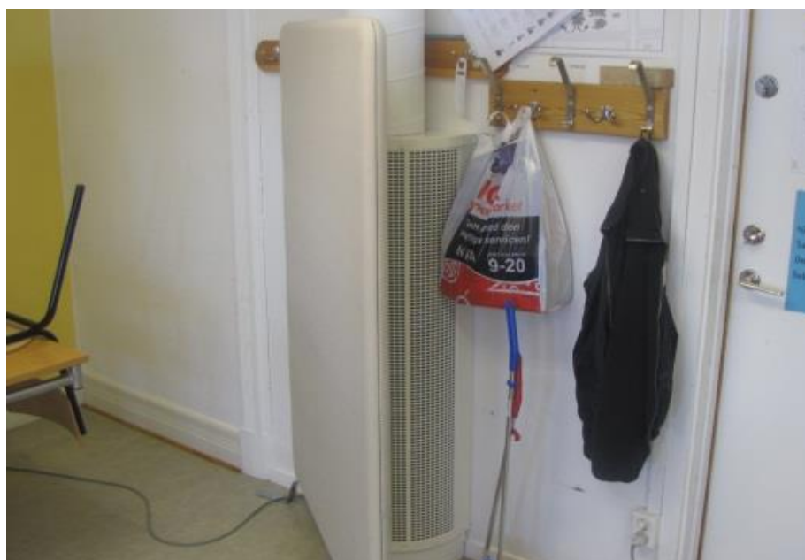
Figur 2 Ventilationen får inte sättas för. Sätts ventilationen för fungerar det inte som tänkt, och kan orsaka störningar i andra delar av huset.