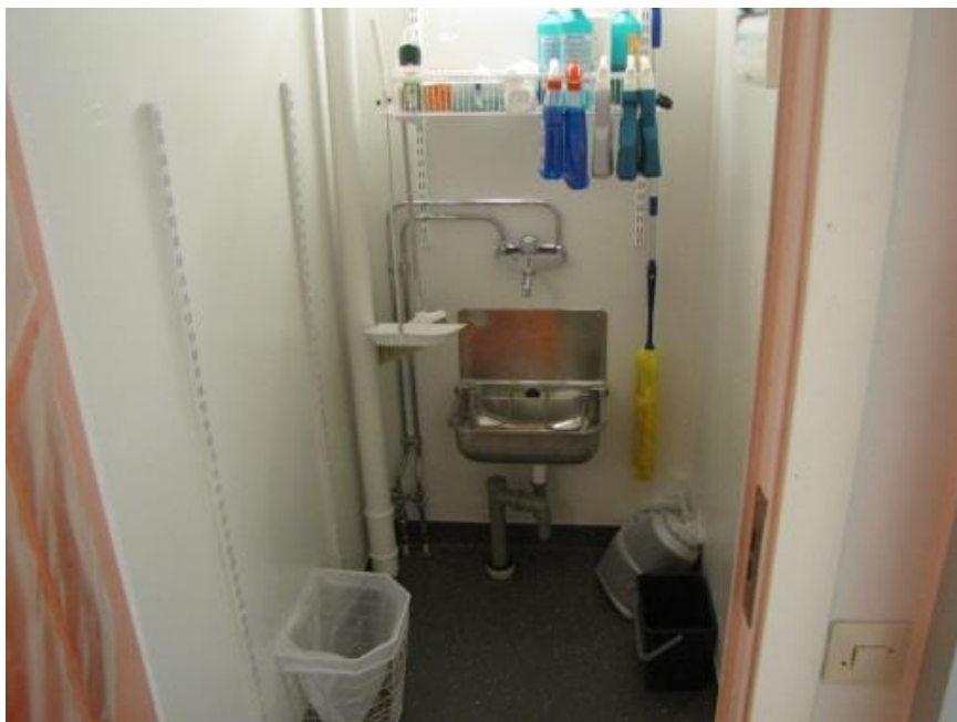
Figur 5 Så här kan ett välordnat städutrymme se ut.