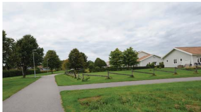
Befintligt staket i fastighetens sydvästra hörn