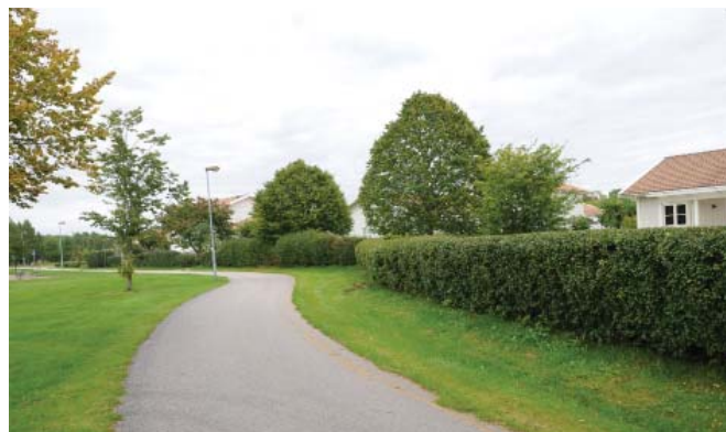
Befintlig häck utmed fastighetens västra gräns

Det har ansetts rimligt att planbestämmelserna änd- ras så att hela planområdet ges rätt att uppföra hus i två våningar. Några ytterligare bostadslägenheter kommer dock inte att tillskapas.