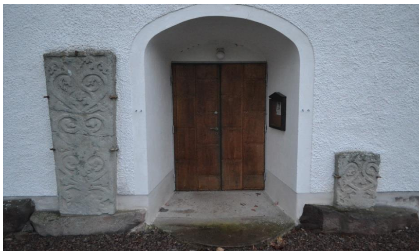
Ekeskogs Kyrkoport med 2 Liljestenar