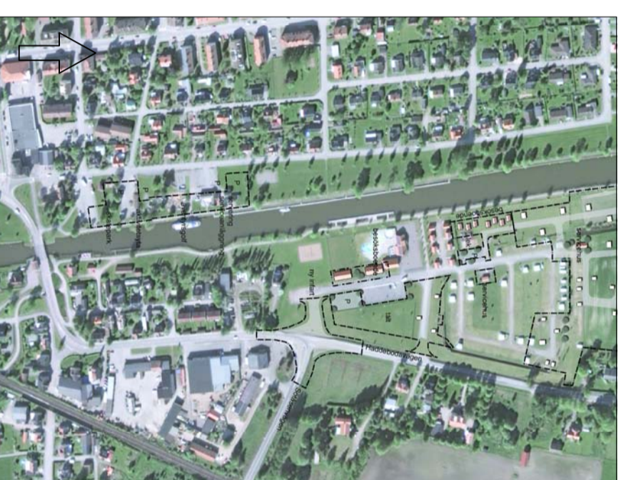
ORIENTERINGSKARTAN FÖR PLANERING ÖVER HELA CAMPINGEN