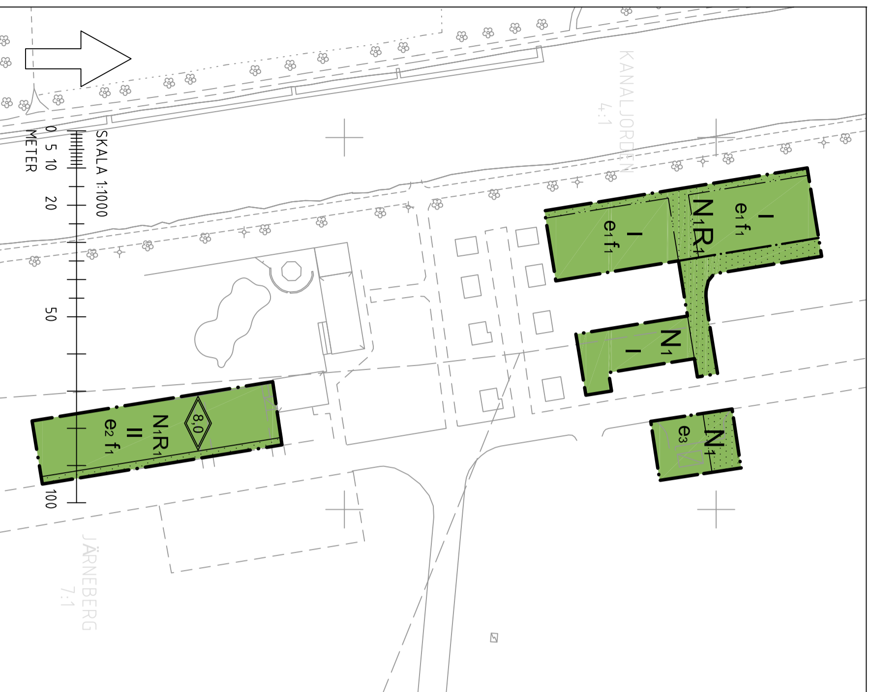
TILLÄGG TILL PLANKARTAN 1:1000 (A2)