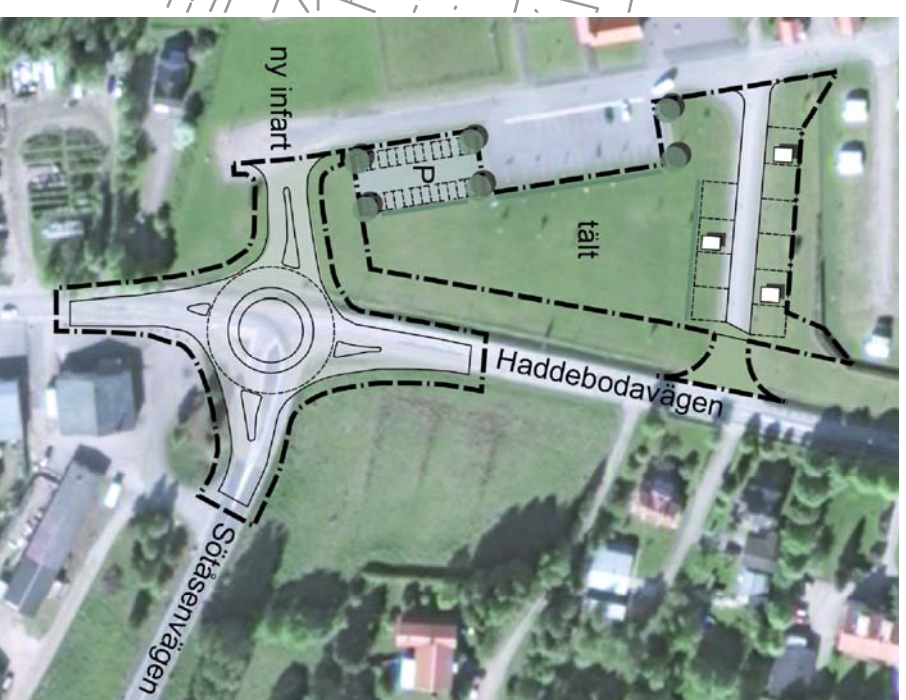
ILLUSTRATION - CAMPINGOMRÅDET