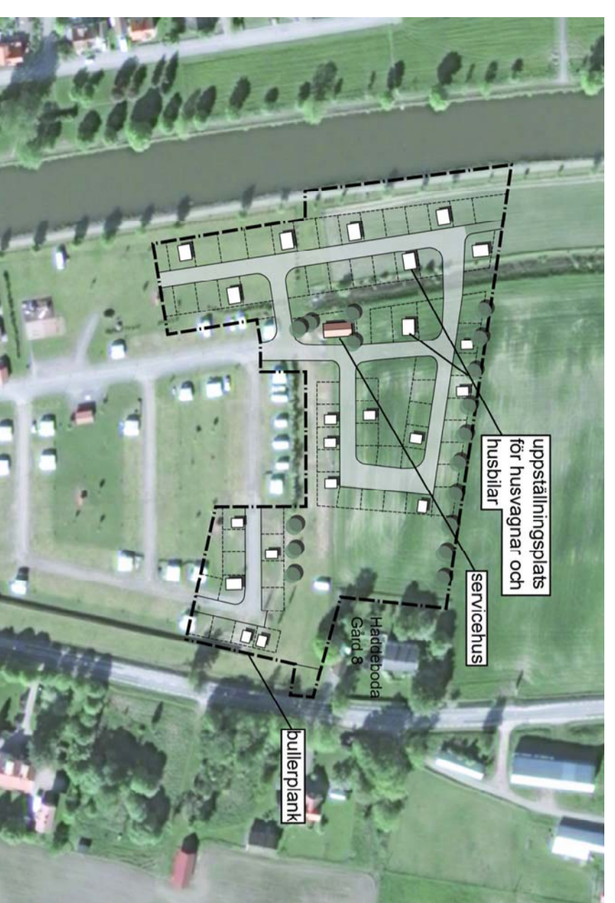
ILLUSTRATION - AKTUELLT CAMPINGOMRÅDE